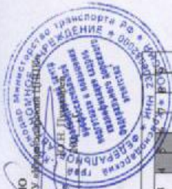
Группа № ____ (водитель категории «А»), первая обучающая группа: _____ Классный учебный график